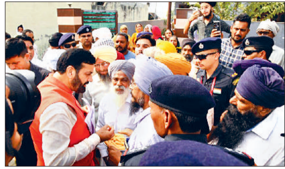
हरि भूमि न्यूज ►► लाडवा