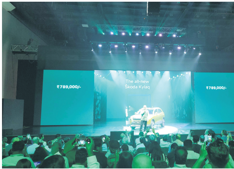
The Skoda Kylaq was launched on Wednesday at an ex-showroom price of ₹7.89 lakh. Full price details will be revealed on 2 December, when bookings open.

With ambitions to sell 100,000 units in the mid-term, Skoda sees its success tied to balancing premium features with competitive pricing. "We are bringing a very good package of European technology, modern design, and high safety for a very